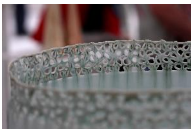
1 er prix : Hélène Lathoumétique