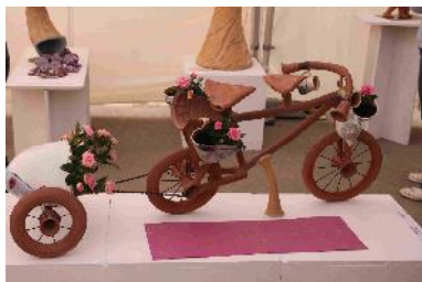
2 ème prix : Mali Vignon